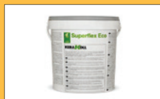
Montážní lepidlo SuperFlex Eco ( exteriér )