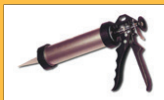
Montážní lepidlo MEGA FIX ( interiér )