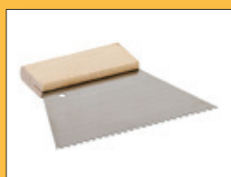
Ozubená stěrka s výškou hřebene 6 mm