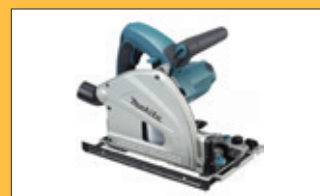
Kotoučová pila nebo úhlová bruska